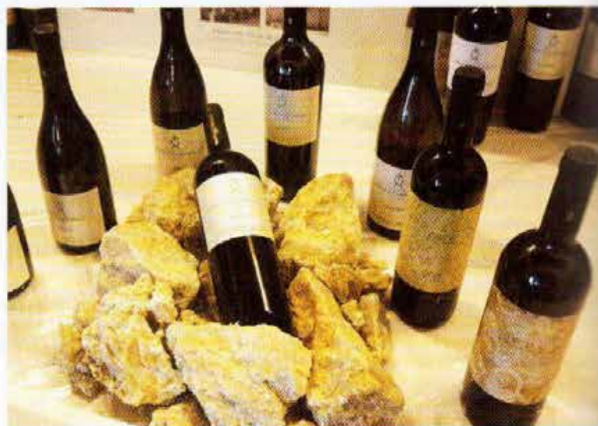
Kalkstein prägt die Weine von Cristo di Campobello