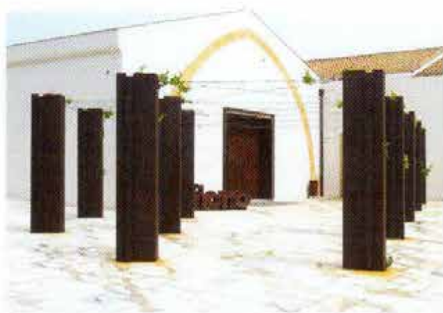
Fiorios Marsala-Wunderwelt ist eine empfehlenswerte Attraktion für Fans dieses Weintyps