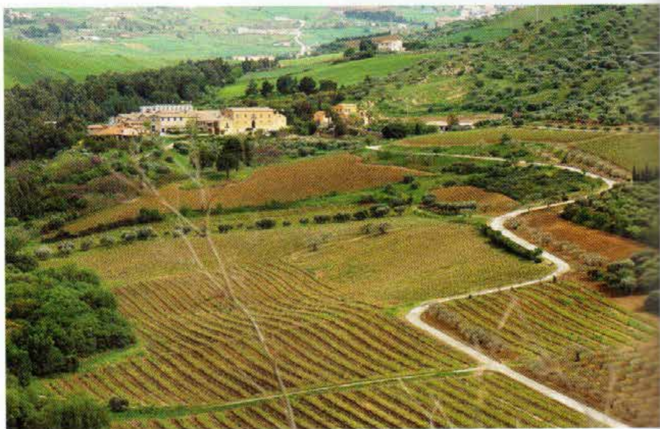
Die Tenuta Regaleali von Tasca d'Almerita liegt 50 km südöstlich von Palermo und ist eine Welt für sich

Geld regiert die Welt ... in Siziliens Weinbau kommt aber noch eine gute Portion Liebe dazu, wie wir im Westen und im Zentrum der Insel feststellen konnten.