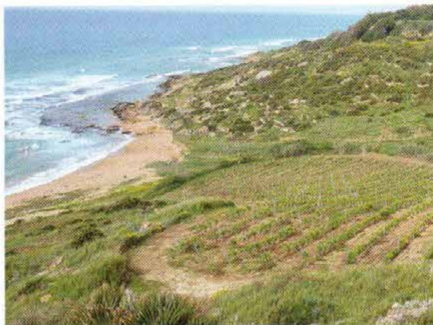
Der Weingarten mit Meerblick gehört zur Settesoli-Genossenschaft in Menfi an der Südwestküste

hat: Er saugt Wasser auf und hält es, was in einer heißen, windreichen Zone von unschätzbarem Wert ist. Wind kommt aus Norden und Nordwesten, er trocknet und kühlt. Aus Osten und Süden kommend ist er deutlich wärmer und soll auch die reizvolle Salzigkeit bringen, die in vielen sizilianischen Weinen zu finden ist. Der Wind sorgt auch für ein weiteres Plus, welches in Sizilien und nicht nur dort aufs Höchste geschätzt wird: nämlich große Unterschiede zwischen Tag- und Nacht-Temperaturen. In der Nacht kühlt er die 40 °C Tagestemperatur, die im Sommer keine Seltenheit sind, auf etwa 25 °C ab.